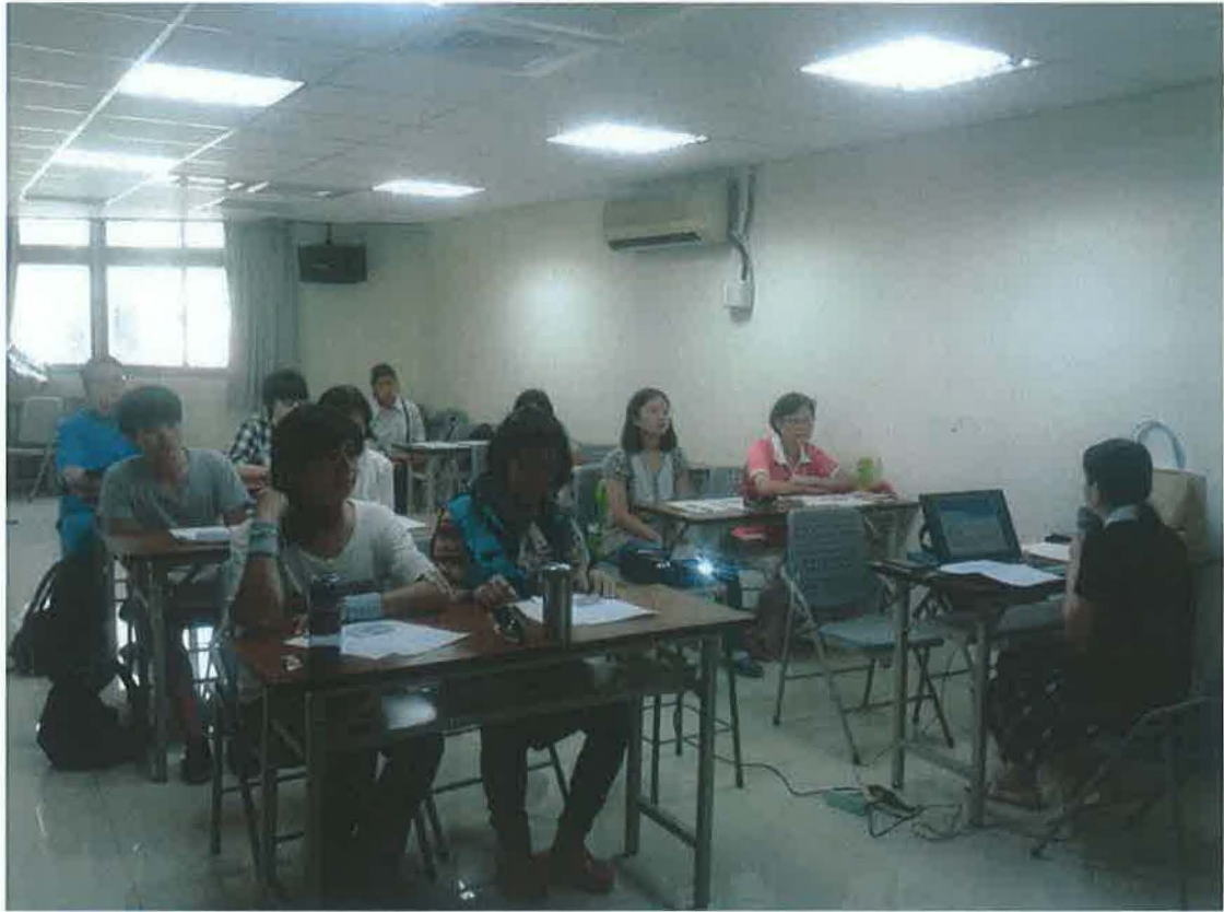
課輔師資培訓研習-學員全神貫注聽講