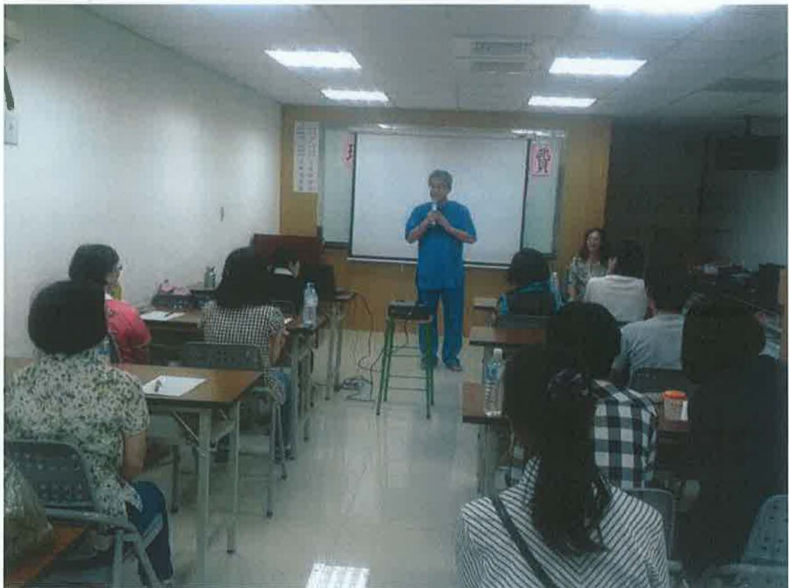
課輔師資培訓研習-本基金會創辦人向全體輔導老師致意