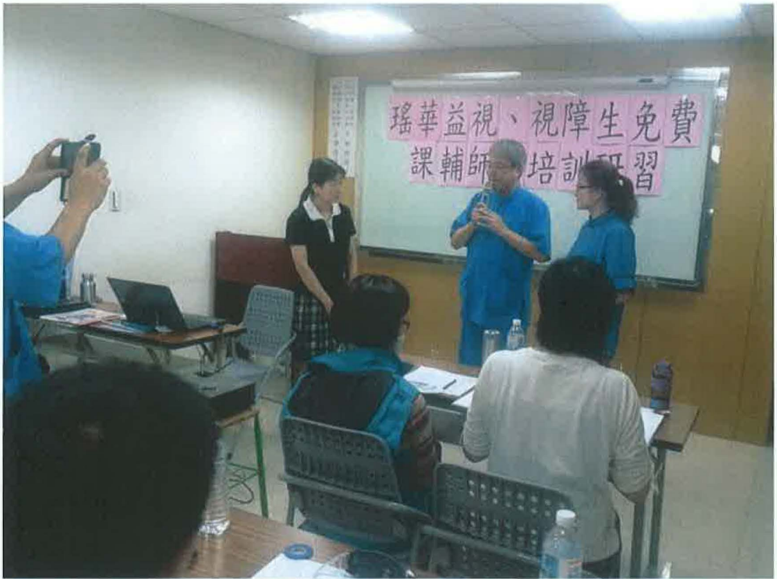
課輔師資培訓研習-本基金會創辦人及董事長到場向視障專業特教講師致意