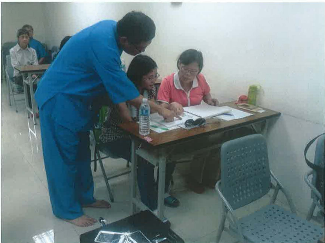
課輔師資培訓研習-學員互相討論學習心得